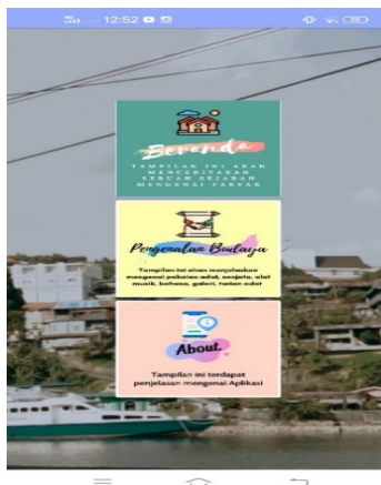
Gambar 4. Tampilan Menu