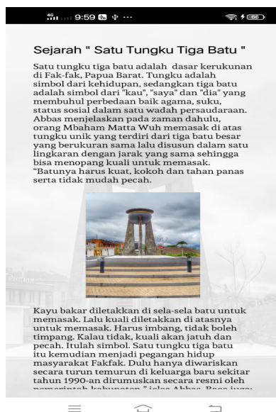
Gambar 6. Tampilan Sejarah Satu Tungku Tiga Batu