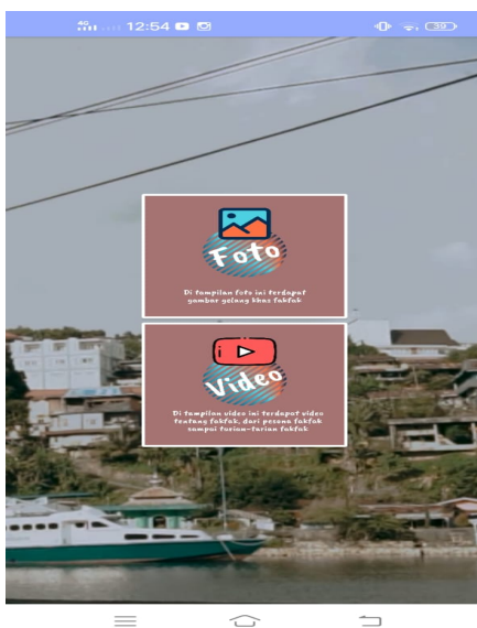
Gambar 7. Tampilan Menu Galeri