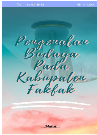
Gambar 3. Tampilan Home