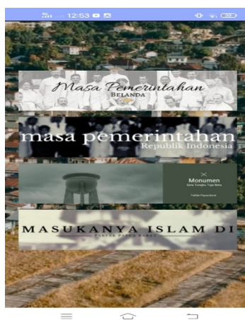
Gambar 5. Tampilan Menu Beranda