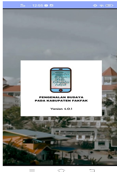
Gambar 8. Menu About