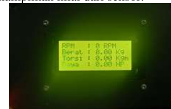
Gambar 3. Tampilan LCD

Pengujian LCD dilakukan dengan tujuan untuk mengetahui apakah LCD bekerja dengan menampilkan nilai dari sensor.