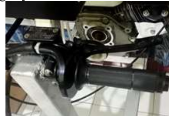
Gambar 2. Handle Gas dan Rem

Pengujian handle gas dan Rem dilakukan dengan tujuan untuk mengetahui apakah komponen tersebut dapat berjalan dengan baik sesuai fungsinya.