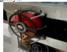
Gambar 4. Kipas Pendingin

Kipas pada penelitian ini berfungsi sebagai pendingin cakram. Fungsi pendinginan sendiri adalah untuk mengurangi suhu berlebih yang di akibatkan oleh daya pengereman yang dilakukan oleh rem. Pengujian ini dilakukan agar mengetahui komponen kipas dapat bekerja sesuai dengan fungsinya.