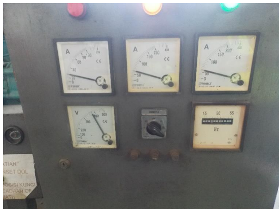
Gambar 16 Panel alat ukur parameter genset untuk tegangan fasa-fasa, arus, dan frekuensi