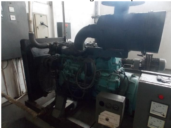
Gambar 7 Kondisi genset tampak kiri dengan panel untuk menyalakan genset