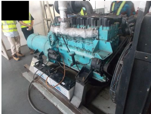
Gambar 6 Kondisi fisik genset tampak kanan