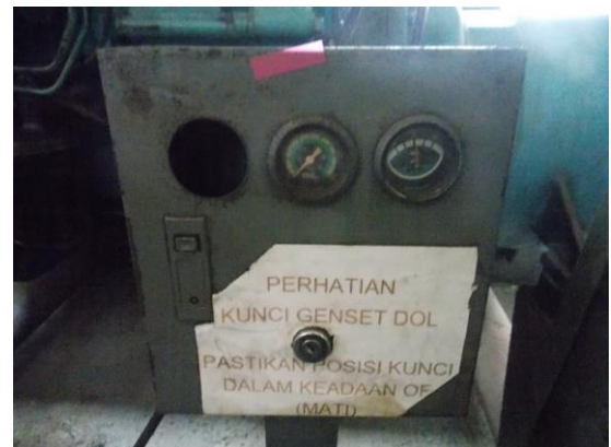
Gambar 10 Kondisi panel starter genset

Panel starter genset, untuk menghidupkan genset. Selot kunci sudah dalam kondisi rusak. Terlihat salah satu alat ukur sudah lepas. Panel dalam kondisi berkarat.