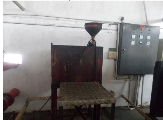
Gambar 9 Tangki bahan bakar tampak depan

tangki. Tangki hanya ditutup corong untuk mengisi solar. Tidak terlihat ada kebocoran mayor (solar menetes). Tangki sudah terlihat berubah warna menjadi kehitaman.