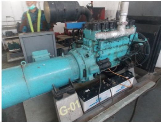
Gambar 1 Generator Set G1

Genset tersebut merupakan genset tipe backup dan bukan merupakan genset prime mover , artinya genset tersebut hanya dioperasikan apabila ada gangguan kelistrikan/pemadaman dari sumber PLN. Genset tersebut tidak dilengkapi dengan ATS ( Automatic transfer switch ) sehingga genset hanya dapat dinyalakan secara manual ketika ada pemadaman PLN. Genset tersebut memiliki jadwal pemeriksaan rutin setiap seminggu tiga kali (Selasa, Kamis, dan Sabtu) meliputi pemeriksaan fisik, fungsi genset, aki, dan warming up dengan durasi 10 menit. Kemudian data penggunaan genset apabila terjadi pemadaman, semua tercatat dalam dokumen riwayat bulanan pemakaian. Berdasarkan review dokumen laporan pemakaian genset, pemakaian genset tersebut semenjak Juli 2020 hingga Juni 2021 (1 tahun) beroperasi selama 80 jam 12 menit.