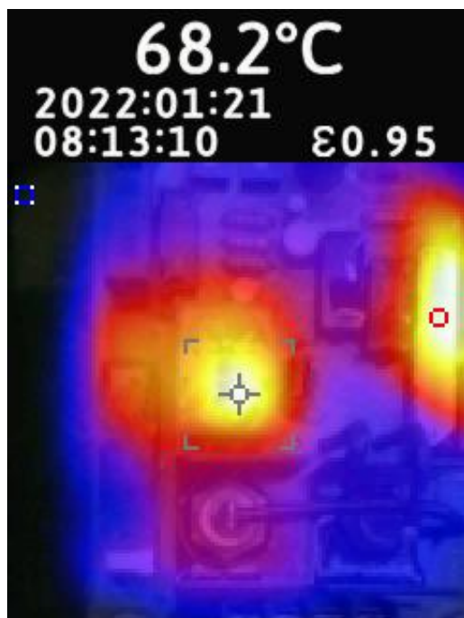
Gambar 20 Titik panas panel genset pada AVR bagian relay