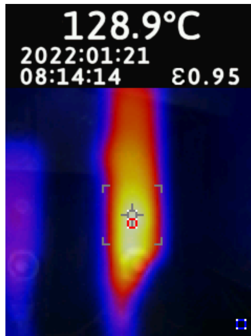
Gambar 18 Titik panas panel genset pada busbar fasa T

Kemudian dilakukan uji titik panas pada panel genset dan didapatkan hasil sebagai berikut.