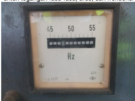
Gambar 17 Frekuensi genset yang jauh di bawah standar

Setelah hasil inspeksi pembebanan, didapatkan hasil bahwa genset G-01 dalam kondisi yang kurang baik, karena setelah dibebani sekitar 46 kVA walaupun parameter tegangan yang ditunjukkan generator menunjukkan hasil yang baik, namun parameter frekuensi menunjukkan angka di bawah standar. Secara garis besar genset mampu untuk memikul beban kelistrikan terminal bahan bakar secara darurat, namun perlu dilakukan perbaikan atau penggantian genset agar peralatan listrik pada plant dapat bekerja secara normal dan aman pada saat PLN padam.