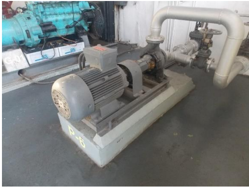
Gambar 5 Posisi genset tepat di sebelah backloading pump