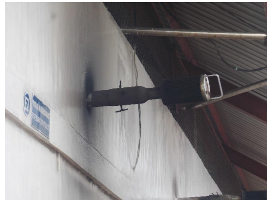
Gambar 14 Asap keluaran diesel terlihat normal pada beban nol