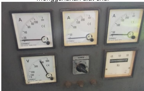
Gambar 13 Parameter genset beban kosong pada panel pengukuran